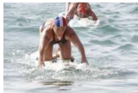
Planche de Sauvetage (Board Race)

Les sauveteurs partent de la plage et doivent nager, contourner les bouées correspondant à l'épreuve et revenir sur la plage pour franchir la ligne d'arrivée.